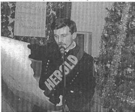
Herold odczytuje regulamin Karczmy Piwnej

Rywalizacja ławy maszynowej z górniczą rozpoczęła się na dobre wraz z pierwszym gongiem. Ławę