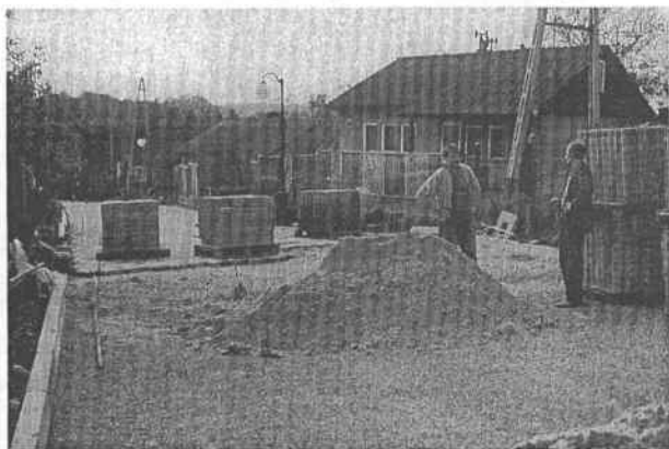
Prace na ulicy Osiedle Kolorowe

Remont kapitalny instalacji centralnego ogrzewania w Szkole Podstawowej nr 1.