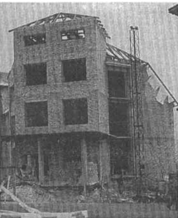
Budynek administracyjno-usługowy w budowie

Szóste. Sądzę, że sukcesem działania samorządowego można nazwać fakt dokonania w tym krótkim czasie poważnych robót inwestycyjno-remontowych w pięciu obiektach gminnych. A mianowicie: kompletna moder-