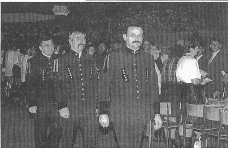
„...wstępuj, wstępuj Prezesie mój” śpiewali gwarkowie