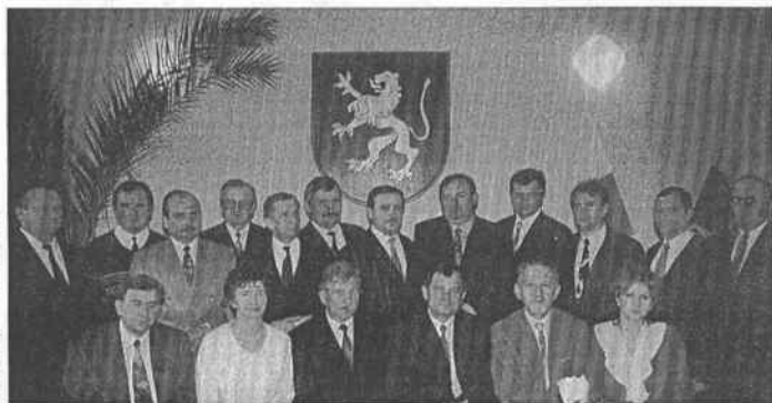
Radni Gminy Markłowice podczas inauguracyjnej sesji

Komisja zajmuje się sprawami: polityki budżetowej i podatkowej; zagospodarowaniem przestrzennym; polityką inwestycyjną; rozwojem przemysłu handlu i usług; przekształcaniami własnościowymi; inicjatywami społecznymi; gospodarką mieniem komunalnym; rozwojem samorządności; komunikacją i organizacją ruchu drogowego; telekomunikacją; cmentarzami; zmianą nazw ulic, placów publicznych i wznoszenia pomników; ochroną środowiska; gospodarką gruntami rolnymi i leśnymi.