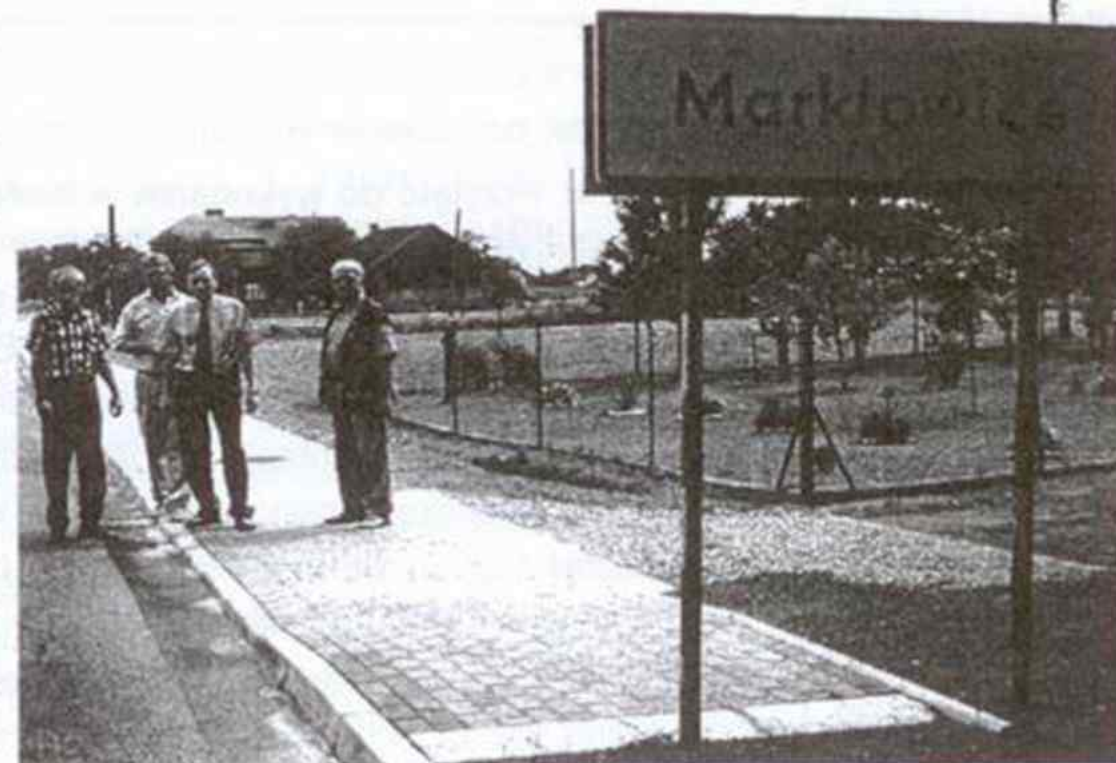
Zakończono prace na ulicy Szymanowskiego