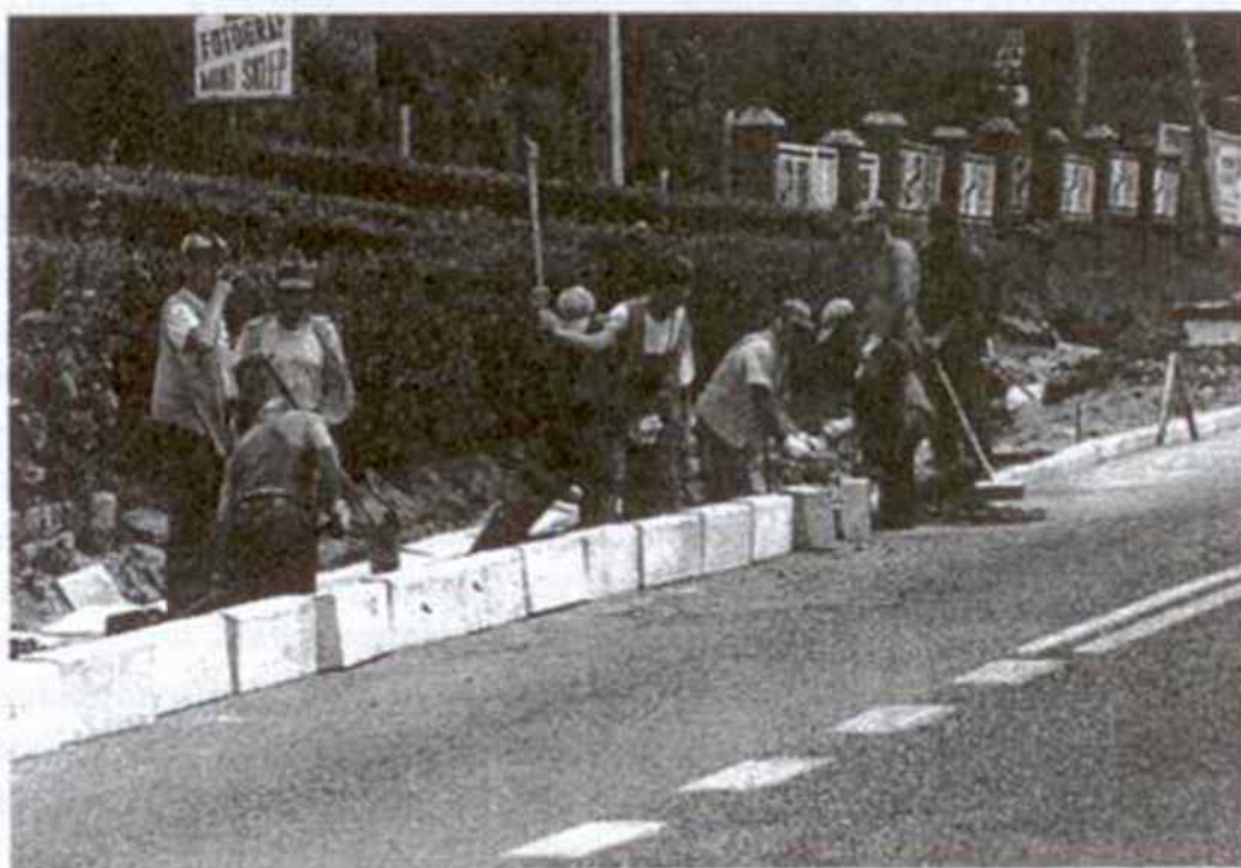
Remont chodnika na ulicy Wyzwolenia zakończony zostanie w sierpniu

Ponadto przebudowana została zatoka autobusowa przy ulicy Wyzwolenia - przed sklepem GS.