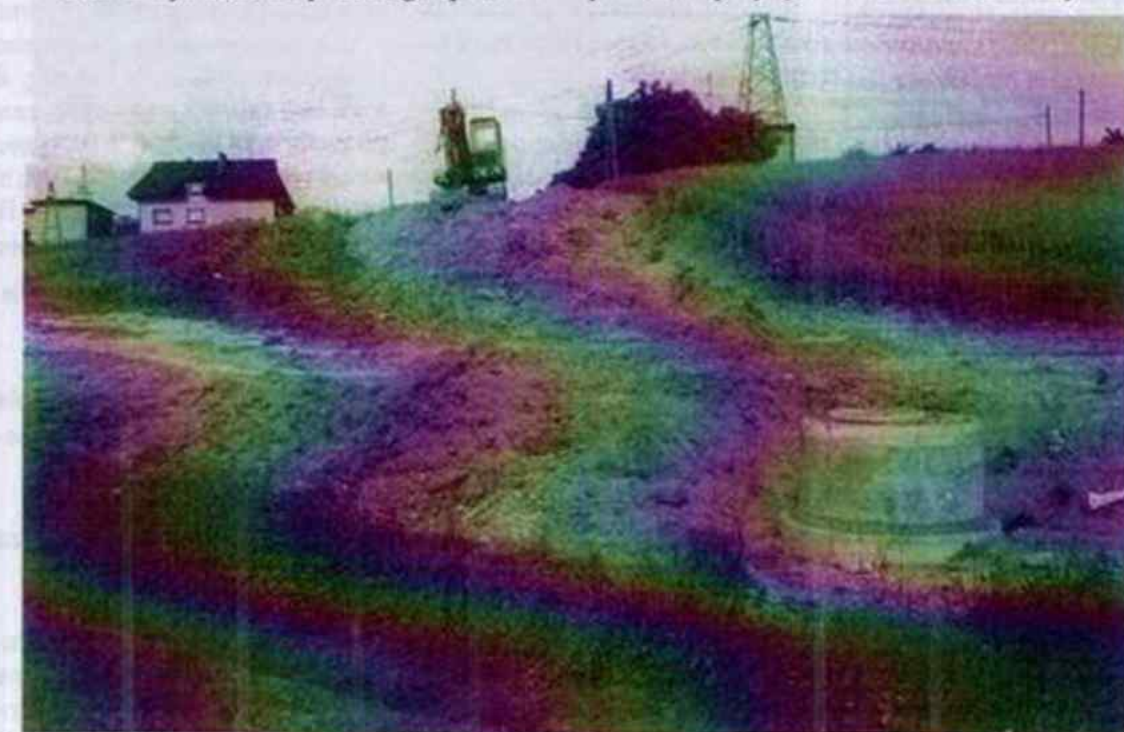
Inwestycja finansowana w części ze środków pomocowych PHARE, realizowana jest przez Wodzisławskie Przedsiębiorstwo Robót Inwestycyjnych

W celu uniknięcia długiego oczekiwania w kolejce na załatwienie sprawy, prosi się o dostosowanie się do podanych na str. 2 terminów.