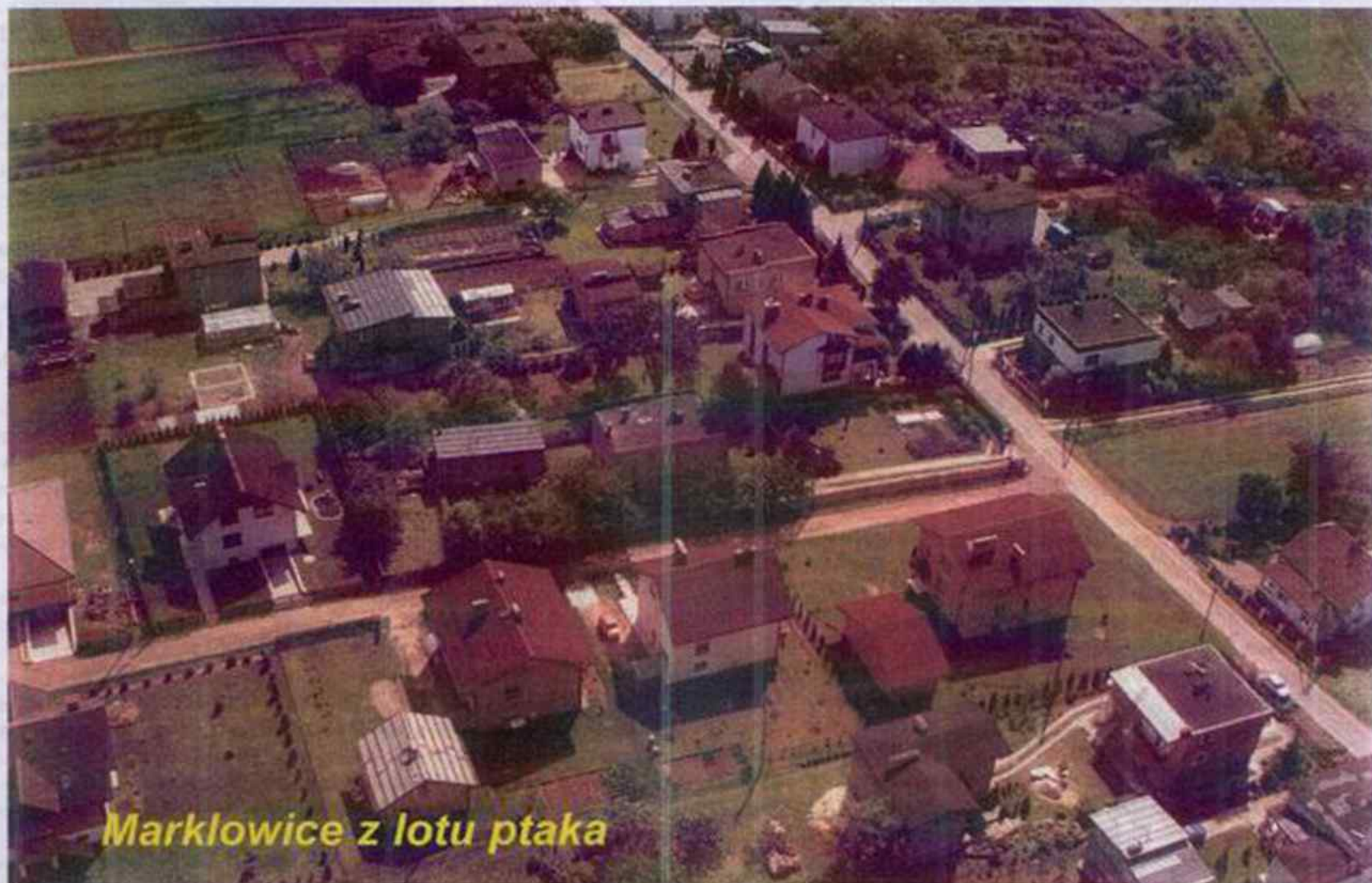
Markłowice z lotu ptaka

MARKŁOWICKI Dwumiesięczna Gazeta Samorządowa