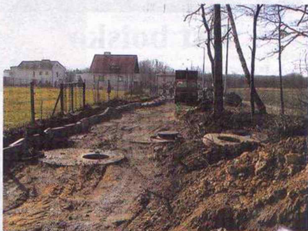
Tak wyglądał plac budowy w marcu tego roku

Zakończenie pierwszego etapu budowy kanalizacji sanitarnej na ulicy Orlej w Markłowicach, umożliwi wykonanie przyłączy do posesji prywatnych w tym rejonie. Szerzej na ten temat piszemy na stronie 2 "Kuriera".