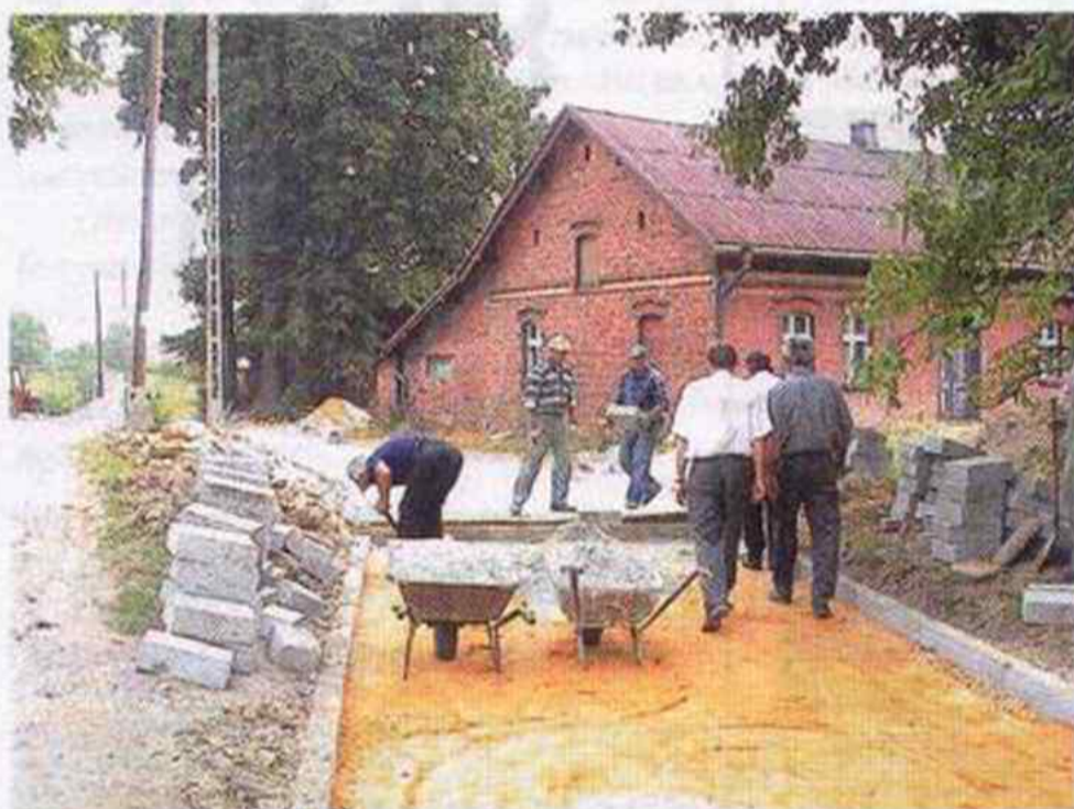
Budowa drogi na ulicy Lipowej

Z końcem sierpnia br. zostały zakończone zaplanowane na ten rok inwestycje związane z budową dróg lokalnych na terenie Markłowic. W tym roku wybudowano pięć dróg na ulicach: Zgody, Lipowej, bocznej Goplany, bocznej Krakusa, bocznej Orlej. Budowa dróg lokalnych kosztowała budżet Gminy ok. 174 tys. zł.