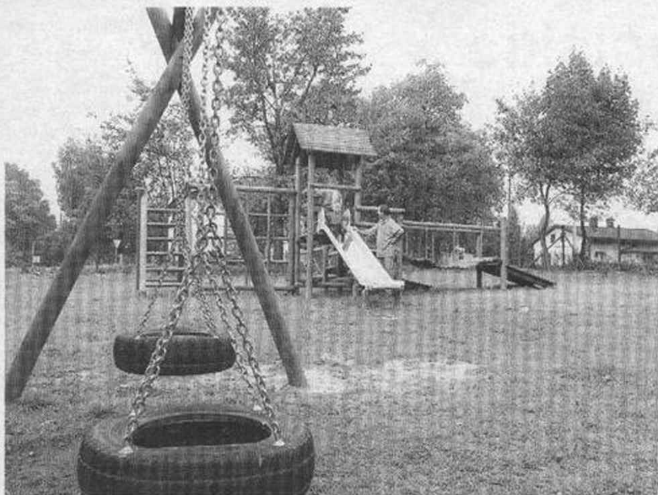
Plac zabaw przy Szkole Podstawowej nr 3