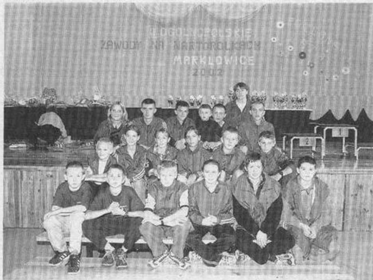
Drużyna UMKS Markłowice startująca w zawodach 21 i 22 września

Pierwszego dnia na dwukilometrową trasę wybiegły dziewczyny rocznika 1991 i starsze, reprezentujące m.in. kluby: Rawa Siedlce, Puszcza Supraśl i Klimczok z Bystrej.