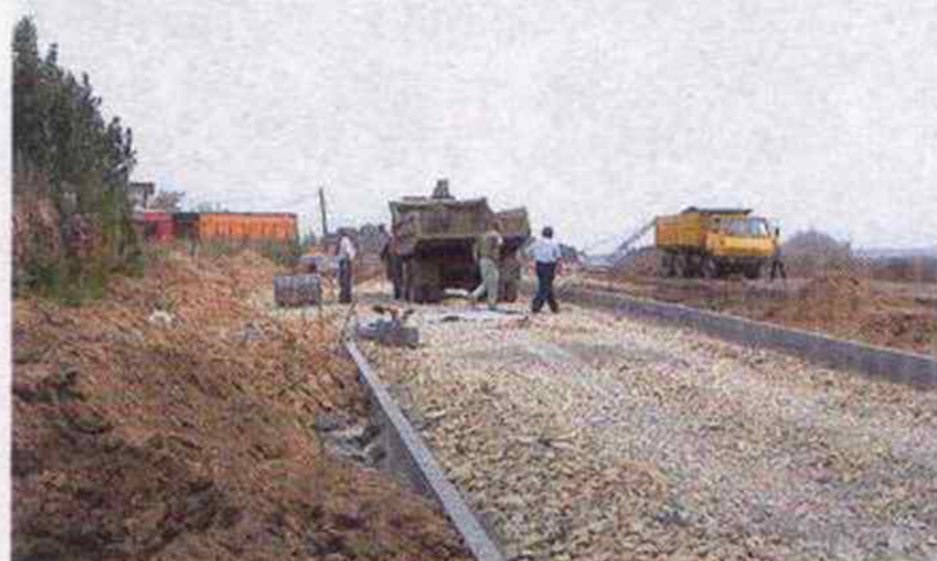
Na terenie Strefy Aktywności Gospodarczej budowane są nowe drogi dojazdowe

Na terenie Strefy Aktywności Gospodarczej w Markłowicach zostały zakończone roboty związane z budową kanalizacji deszczowej, sanitarnej i wodociągowej.