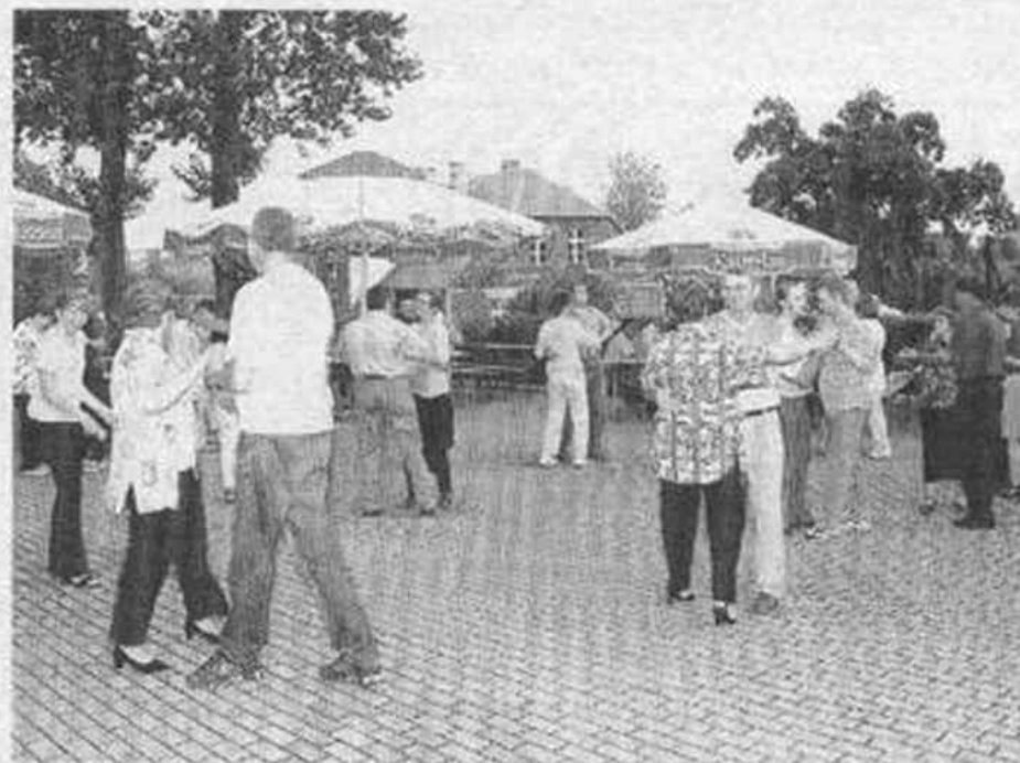
Do tańca przy Szkole Podstawowej nr 1 w trakcie cyklicznych sobotnich spotkań przygrywały zespoły: Acord, Kwartet, Quatro, Duo Vocal & Sax, Amadeus i Adagio

Na tych mini-festynach zawsze można było się posilić kielbaską czy śląskim krupniakiem. A były też i placki ziemniaczane, które cieszyły się dużym wzięciem.