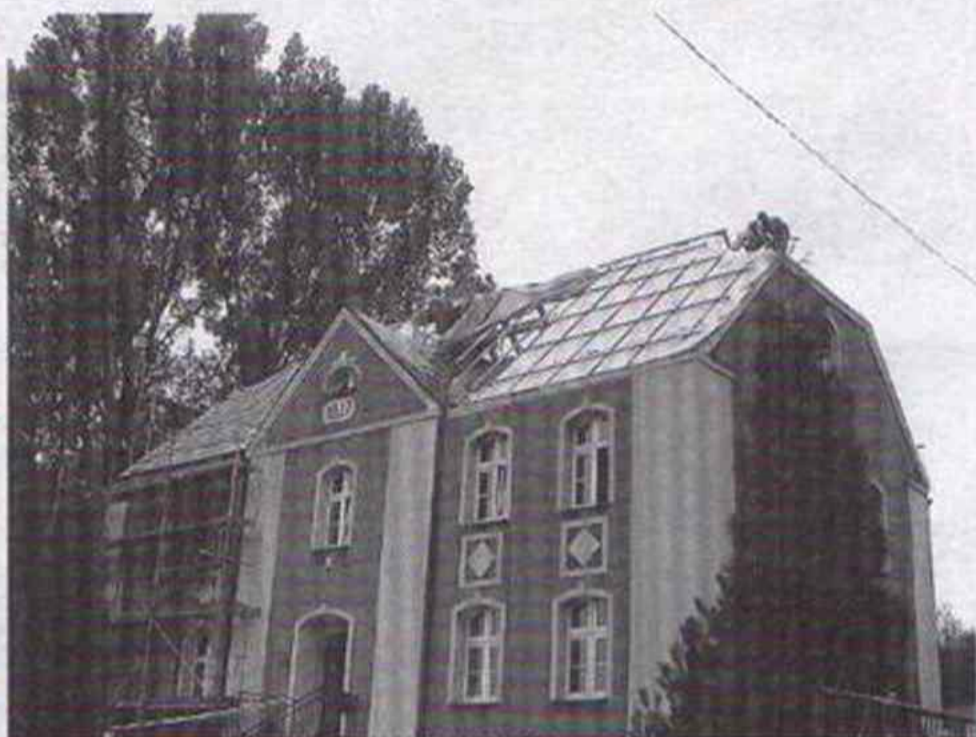
Wymiana dachu na budynku przedszkola

W okresie przerwy wakacyjnej w Przedszkolu Publicznym wymieniono konstrukcję dachu, pokrycie dachu i wyremontowano II piętro budynku. W trakcie prac remontowych na II piętrze okazało