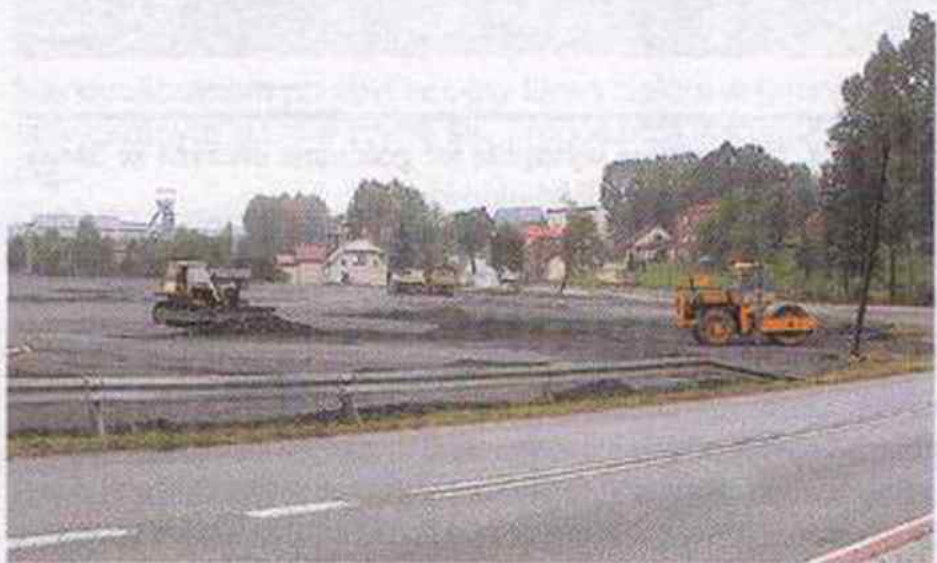
Dobiegają końca prace związane z zasypywaniem terenu położonego przy ulicy Wyzwolenia na przeciw kościoła pw. Św. SBiM

Dobiegają końca prace związane z zasypywaniem terenu położonego przy ulicy Wyzwolenia naprzeciw kościoła pw. Św. SBiM w