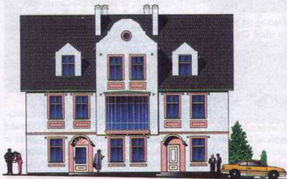
Tak będzie wyglądał budynek Apteki w Markłowicach - tzw. Grzonkowina

Firma Budwex z Rybnika wygrała przetarg na adaptację budynku komunalnego tzw. Grzonkowiny.