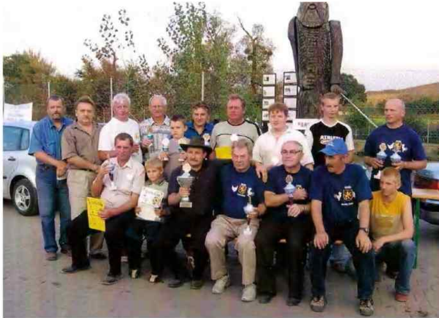
Markłowiccy hodowcy na wystawie w Mini ZOO w Bukowie

Ptactwo i zwierzęta hodowców zrzeszonych w Klubie mogliśmy podziwiać w całej okazałości na wystawie zorganizowanej z okazji Dni Markłowic i dożynek, a także