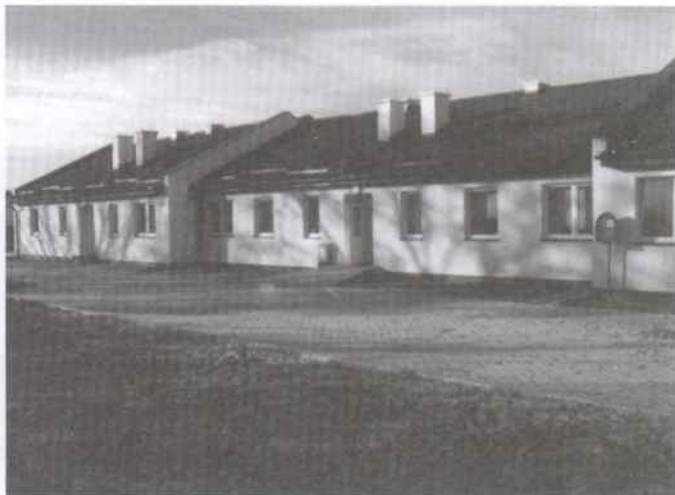
Odbudowany budynek socjalny w którym zamieszkało ponownie 21 osób, w tym rodziny z dziećmi w wieku szkolnym