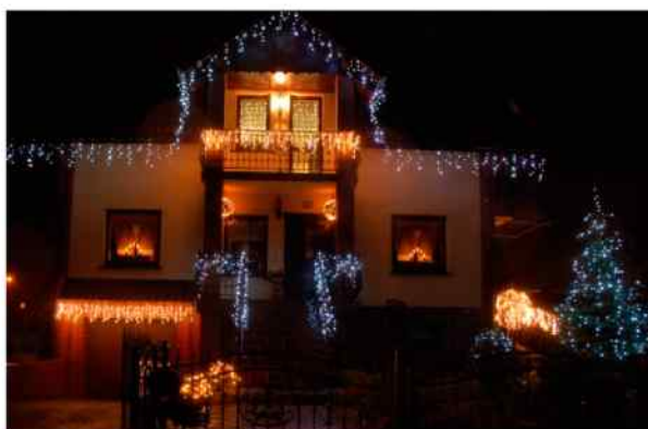
II miejsce Państwo Wita