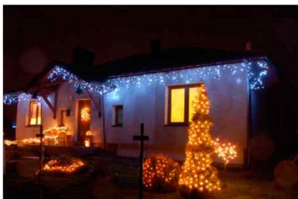
III miejsce Państwo Guderley