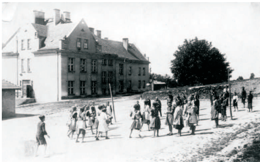
Szkoła Podstawowa nr 1 w Markłowicach po przebudowie w roku 1930.

Pierwszy dzwonek w Szkole Podstawowej nr 1 w Markłowicach rozległ się sto dziesięć lat temu - w 1905 roku. Dziś budynek mimo sędziwego wieku, na wskroś nowoczesny nadal służy markłowickim dzieciom.