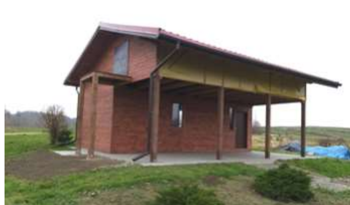
Obecny stan Rybaczówki