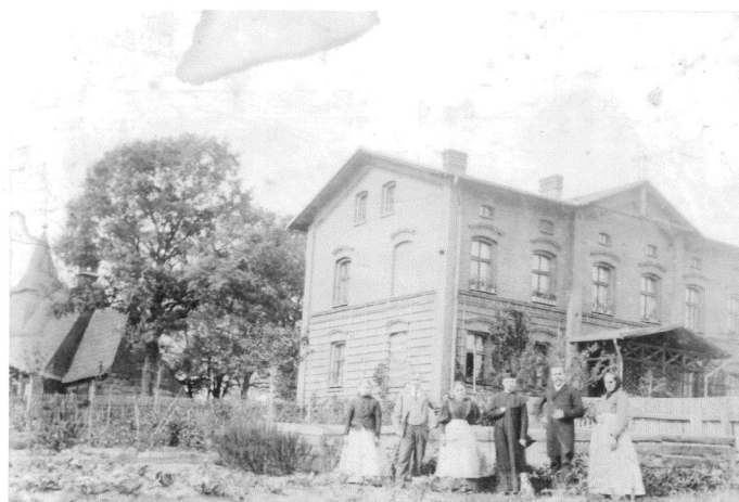
Nowowyzbudowane probostwo reaktywowanej w 1890 roku parafii. Na fotografii pierwszy proboszcz.