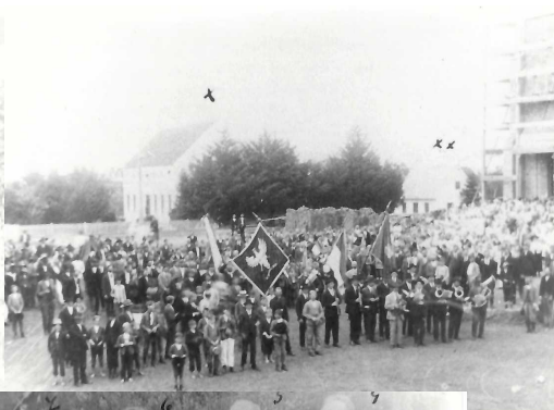
Zdjęcie zrobione w dzień 3 maja 1923 przed budowanym kościołem w Itayapolis (po prawej stronie w rusztowaniach). Dalej widać szkołę (x) którą postawiłem w 1914 r. i szwalnię (xx), w której uczą się dziewczęta szycia. Procesja, która wyszła z kościoła udaje się do domu towarzystwa polonijnego.