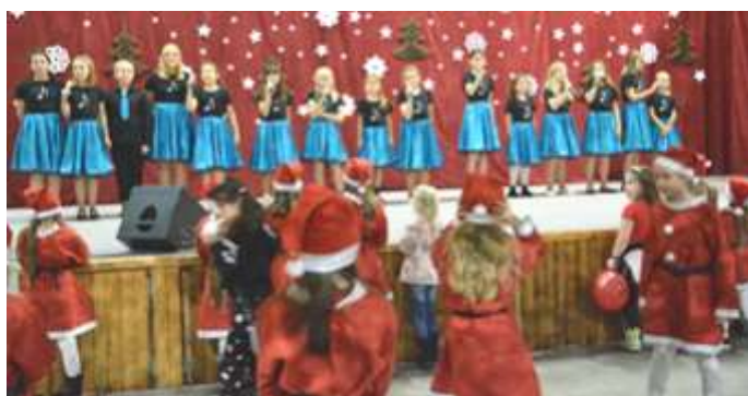
W załączeniu do Kuriera płyta zespołu RETRO z Markłowic „Kolyndy po naszymu, czyli po ślōnsku”