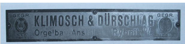
Organy w parafii p.w. Św. Stanisława Biskupa