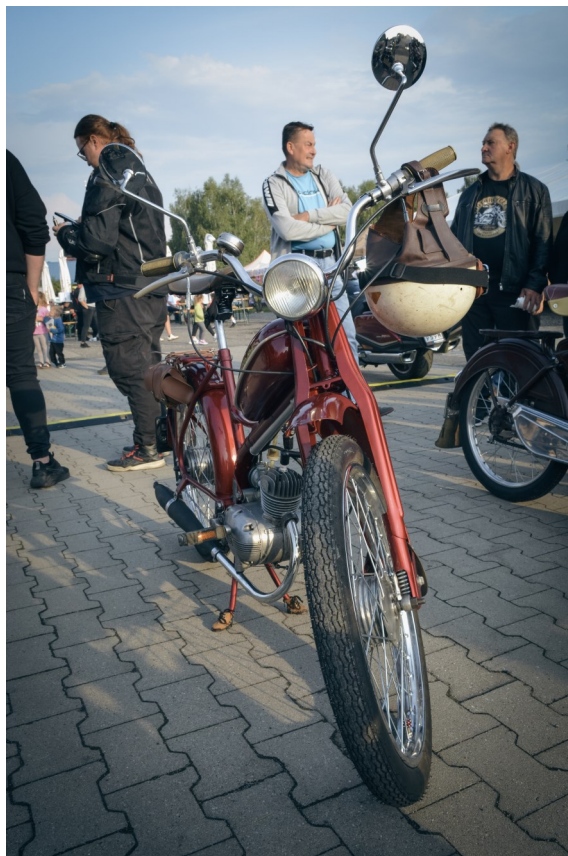
Jedna z perełek złotu motocykli

VIII edycja pokazała, że Marklowice potrafią łączyć tradycję, integrację i działania społeczne, a głośny ryk silników może iść w parze z cichą, ale ogromną mocą serca.