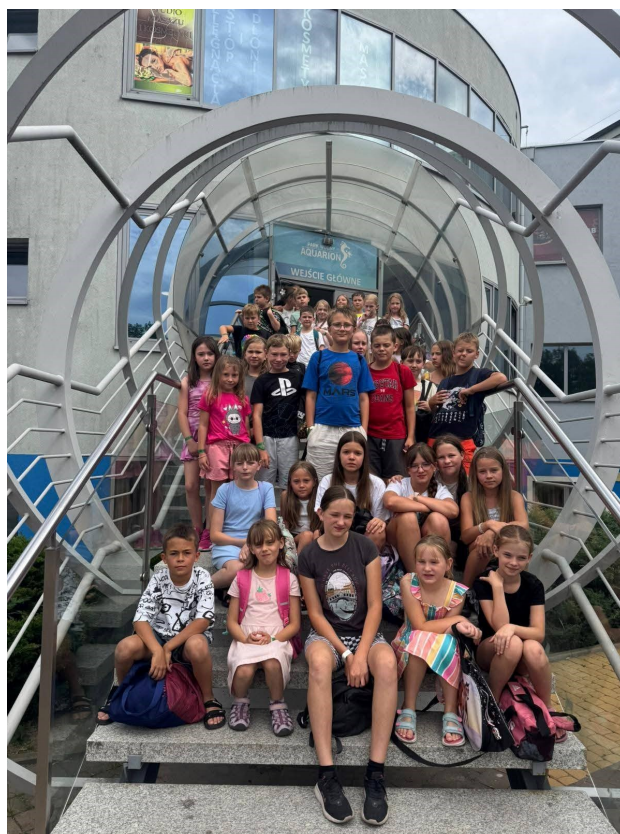
Wycieczka na basen „Aquarion” w Żorach

Półkolonie w gminie Marklowice okazały się doskonałą formą letniego wypoczynku, łączącą aktywność fizyczną, rozrywkę i integrację w bezpiecznym środowisku.