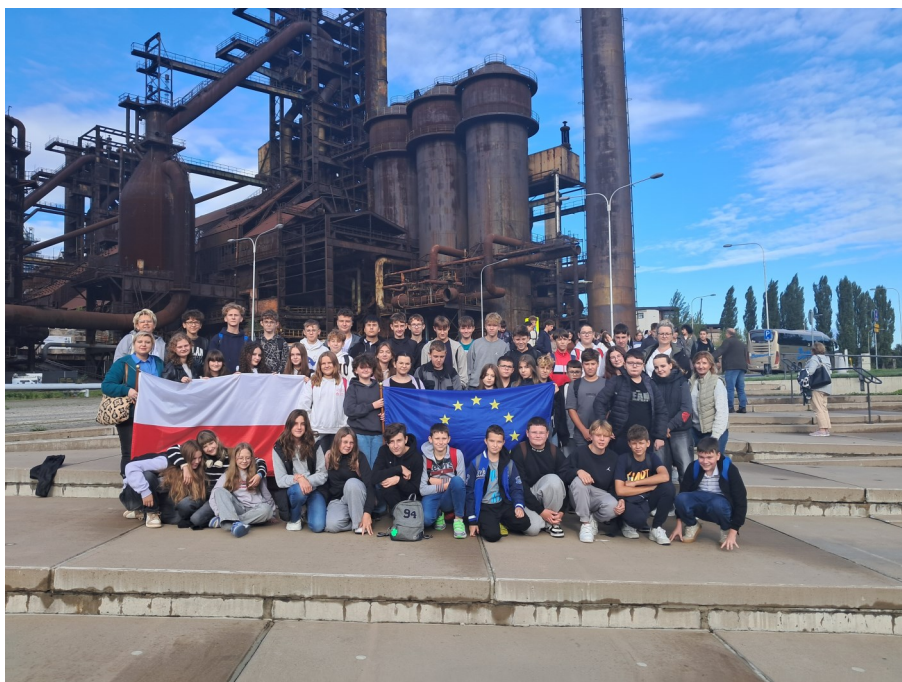
Uczniowie SP1 w Ostrawie-Vitkovicach

17 września w ramach projektu polsko-czeskiego "Na transgranicznych szlakach" odbyło się kolejne działanie, czyli wyjazd do Świata Techniki w Ostrawie – Vitkovicach. 100-osobowa grupa uczestników z SP1 i Zakładni Szkoły w Stonawie pojechała do Ostrawy, aby zwiedzić Instytut Nauki i Techniki z wszystkimi wystawami interaktywnymi: Świat natury, Świat cywilizacji, Świat nauki i odkryć, Życie normalnie. Każdy mógł osobiście eksperymentować i uczyć się przez doświadczenie. Uczniowie wzięli udział w seansie kina 3D oraz integrowali się podczas posiłków. To był dobrze spędzony czas na nauce przez zabawę. Zgodnie z głównymi założeniami projektu wyjazd miał na celu pogłębienie współpracy w dziedzinie społecznej między partnerskimi szkołami oraz wzmocnienie i rozszerzenie kontaktów rówieśniczych po pandemii COVID.