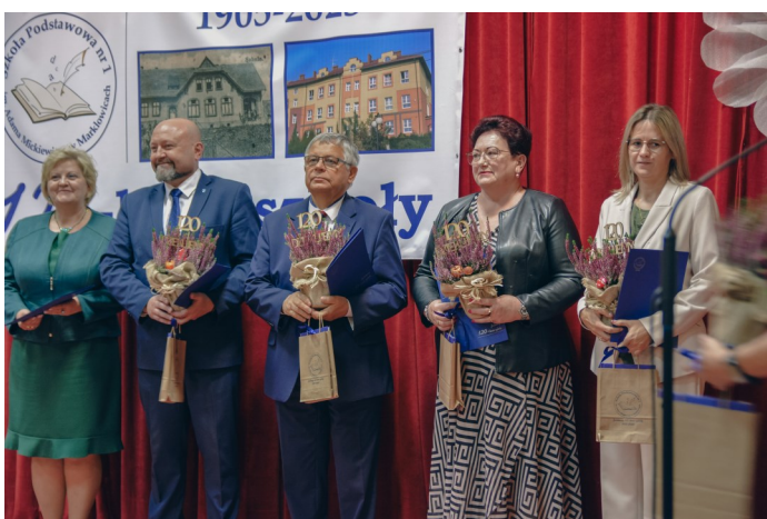
Obchody Jubileuszu uświetniły występy uczniów oraz wystąpienia zaproszonych gości