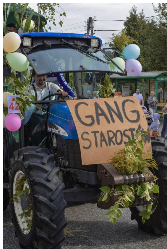
Jeden z pojazdów korowodu