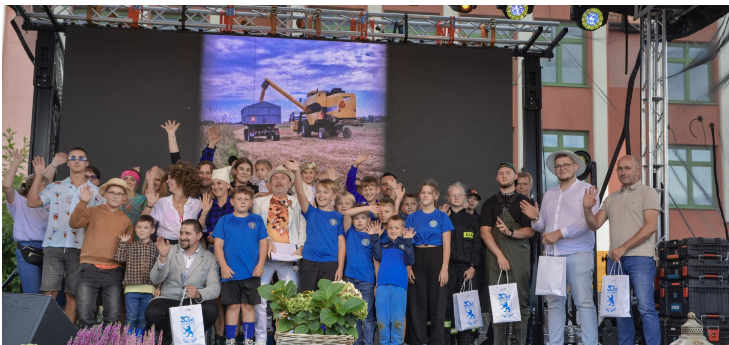
Zwycięscy konkursu na najciekawszy pojazd w korowodzie