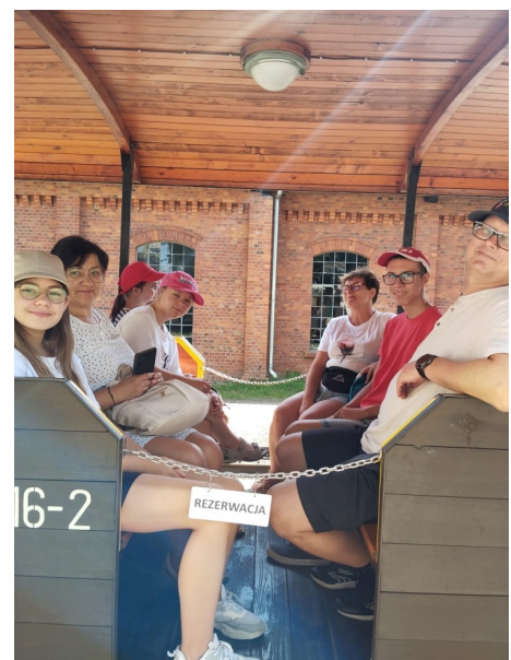
Pieczenie kiełbasek oraz przejazd kolejką wąskotorową w ramach półkolonii