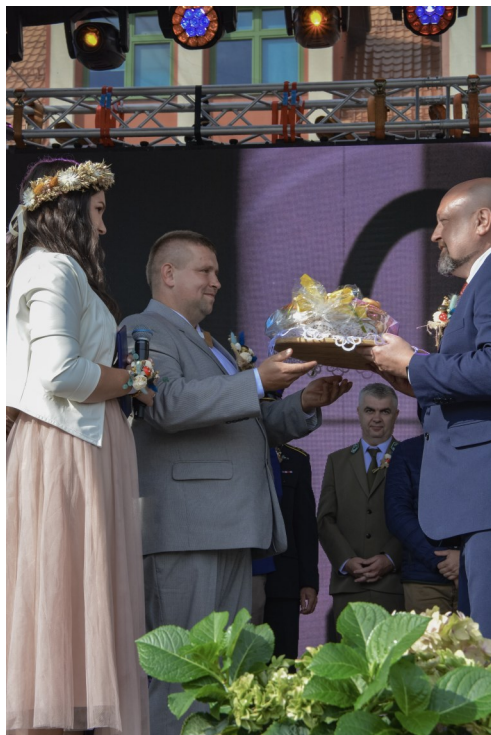
Przekazanie chleba dożynkowego