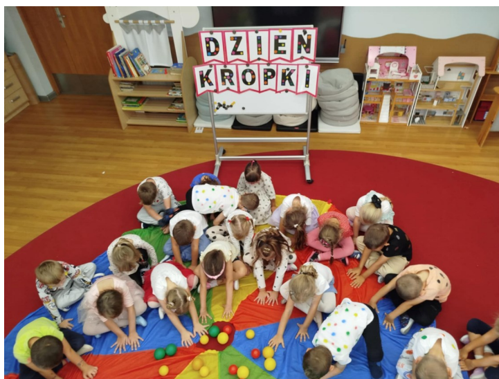
Dzień Kropki w przedszkolu