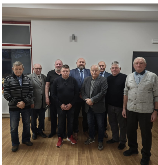
Członkowie Klubu Hodowców Gołębi, Sekcja Markłowice

Spotkanie przebiegało w serdecznej, przyjaznej atmosferze i stało się okazją do rozmów, wspomnień oraz wymiany doświadczeń między miłośnikami gołębi pocztowych. Hodowcy z Markłowic kolejno raz pokazali, że tradycja ta wciąż żyje i łączy pokolenia.