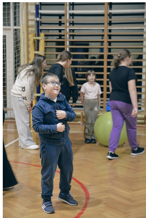
Sportowe zmagania na Spartakiadzie

Każdy uczestnik Spartakiady otrzymał nagrodę, bo najważniejsze było wspólne spędzenie czasu, zaangażowanie i radość płynąca z udziału. Uśmiechy towarzyszące wszystkim przez cały wieczór były najlepszym potwierdzeniem, jak bardzo potrzebne są takie inicjatywy.