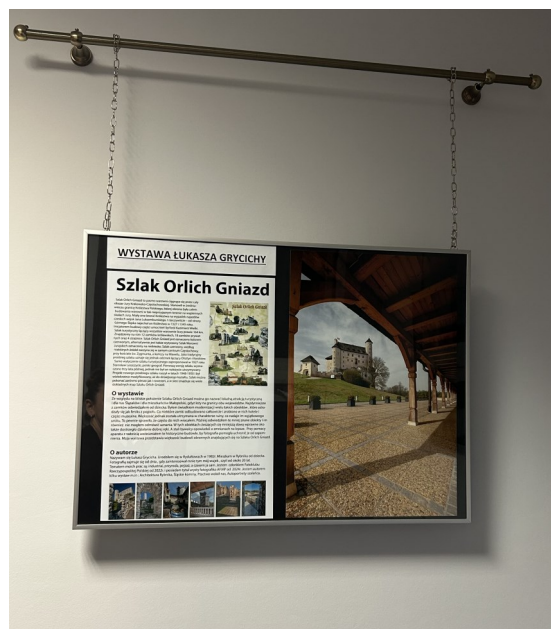
Fragment wystawy Łukasza Grycicha

W Gminnej Bibliotece Publicznej w Markłowicach można podziwiać nową wystawę fotograficzną autorstwa Łukasza Grycicha, poświęconą jednemu z najpiękniejszych i najbardziej rozpoznawalnych regionów w kraju – Szlakowi Orlich Gniazd. Ekspozycja prezentuje wyjątkowe ujęcia zamków i warowni Jury Krakowsko-Częstochowskiej, które od lat przyciągają turystów, miłośników historii oraz fotografii. Autor wystawy, Łukasz Grycicha, od wielu lat dokumentuje piękno regionu. Jego fotografie wyróżnia dbałość o detal, umiejętność uchwycenia nastroju miejsca oraz szacunek dla historii. Artysta od lat działa w środowisku fotograficznym, a jego prace można było oglądać na licznych wystawach w regionie. Najnowszy cykl jest efektem wieloletnich wędrówek i fotograficznych powrotów do zamków Jury, zarówno tych popularnych, jak i mniej znanych. Cieszymy się, że możemy prezentować tę wyjątkową kolekcję właśnie w naszej Bibliotece. Serdecznie zapraszamy do odwiedzenia Biblioteki i obejrzenia wyjątkowej wystawy.