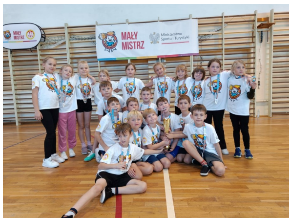
Nasi „Mali Mistrzowie”