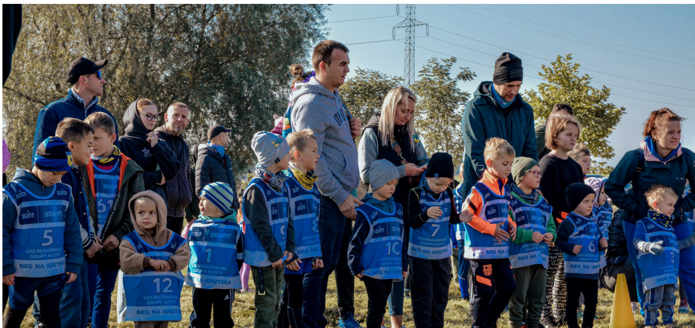
Najmłodsza grupa chłopców uczestniczących w 26. Biegu o Puchar Wójta Gminy Marklowice