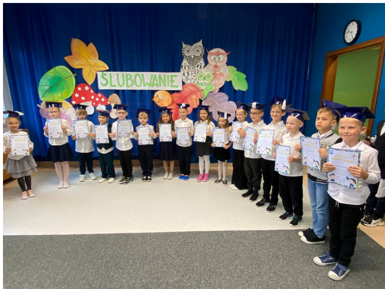
Tegoroczni pierwszoklasiści w SP 2

Tradycją „dwójki” jest, że najmłodszy uczniowie w październiku przeżywają swoją pierwszą ważną uroczystość, jaką jest pasowanie na ucznia pierwszej klasy. 24 października pierwszoklasiści odświętnie ubrani i przejęci rozpoczęli występ, w którym zaprezentowali swoje umiejętności recytatorskie i wokalne. Po zakończeniu części artystycznej, w niezwykle podniosłej atmosferze, przed poczem sztandarowym uczniowie ślubowali być dobrymi Polakami, godnie reprezentować swoją szkołę, swym zachowaniem i nauką sprawiać radość rodzicom i nauczycielom.