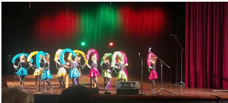
Występ w Miejskim Ośrodku Kultury w Radlinie

Nie zabrakło również muzycznych sukcesów. Dziewczynki z grupy Krasnali , tworzące zespół „Kolorowe Nutki”, wytańczyły II miejsce w Radlińskim Festiwalu Najmłodszych „Mała Poleczka”. Ich pełen wdzięku występ podbił serca publiczności i jury. To piękny dowód na to, że przedszkolaki nie tylko kochają muzykę, ale potrafią ją również wspaniale wyrażać.