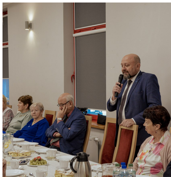
Spotkanie z okazji Dnia Seniora

Życzymy wszystkim Seniorom zdrowia, pogody ducha i wielu pięknych chwil spędzonych w gronie najbliższych.