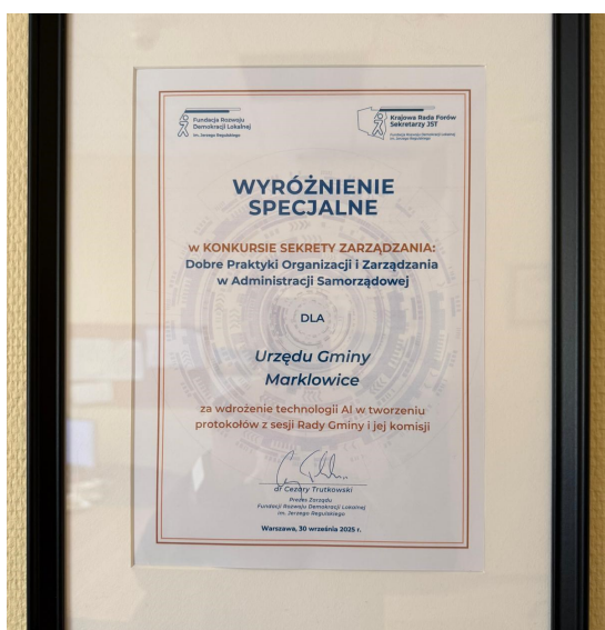
Przyznane wyróżnienie specjalne dla Urzędu Gminy Markłowice