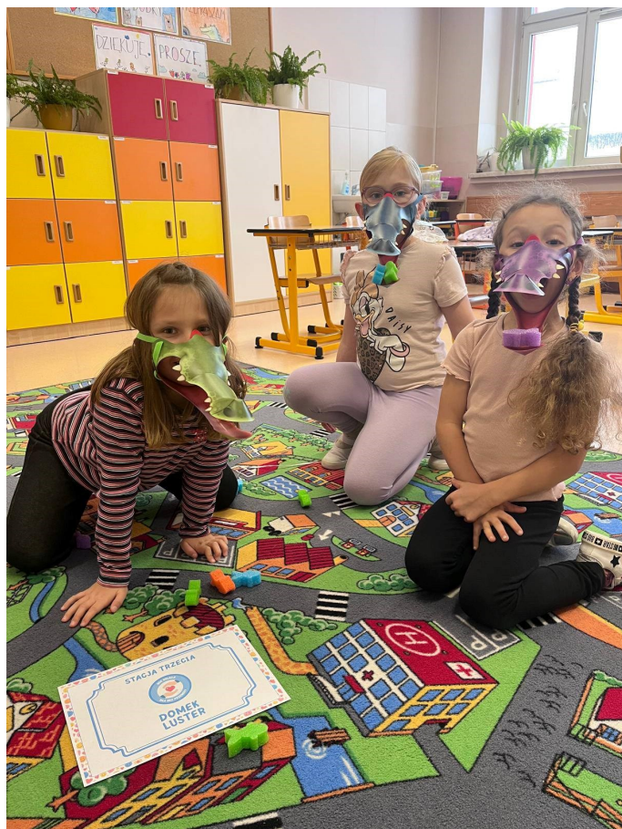
Nauka o emocjach poprzez zabawę

Od grudnia SP2 bierze udział w ogólnopolskim programie edukacyjnym dla klas I - III „Moc relacji - siła bez przemocy”, który ma na celu budowanie pozytywnych relacji i bezpiecznego środowiska w szkole poprzez rozwijanie umiejętności społecznych i emocjonalnych. Uczestniczący uczniowie uczą się rozpoznawać emocje, współpracować, budować empatię i rozwiązywać konflikty w sposób konstruktywny, a także wzmacniać poczucie własnej wartości.