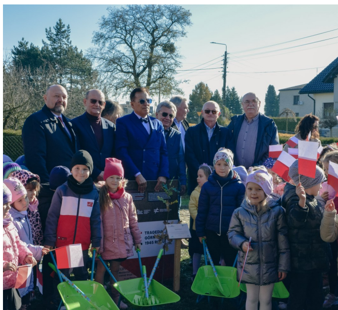
Wspólne zdjęcie z zasadzonym dębem

Symbolicznym i wzruszającym momentem uroczystości było posadzenie „Dębu Pokoju”. Drzewo ma przypominać o sile zgody, poszanowania i jedności.