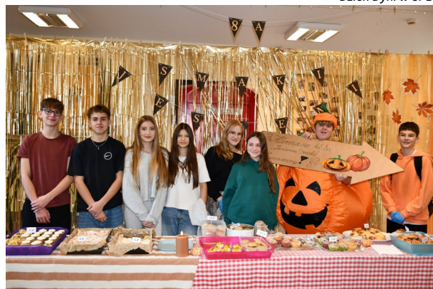
Dzień Dyni w SP1

Samorząd Uczniowski SP1 aktywnie organizuje szkolne wydarzenia. To właśnie z jego inicjatywy odbył się Dzień Dyni z barwną wystawą klas oraz kiermaszem dyniowo-jesiennym 8a, aby nazbierać na wycieczkę szkolną. Miło też było spotkać dyniową maskotkę, która zapraszała do zakupów i zabawy. W listopadzie z rozmachem obchodzono Świątowy Dzień Postaci z Bajek oraz Dzień Pluszowego Misia. Grudzień przyniósł mikołajowe kiermasze klas 8b i 7a, wprowadzając do szkoły magiczną, świąteczną atmosferę. Samorząd prowadzi także akcje charytatywne i zbiórki dla potrzebujących. Oby tak dalej!