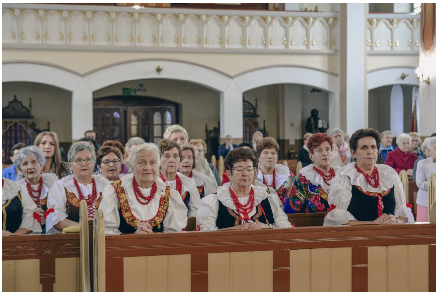
Uroczysta msza święta w kościele p.w. św. Stanisława Błm

W imieniu całej społeczności Markłowic przekazujemy Paniom z KGW wyrazy wdzięczności za wszystkie lata pracy i zaangażowania. Składamy również najserdeczniejsze życzenia zdrowia, pomyślności oraz dalszej, owocnej działalności na rzecz naszej gminy.