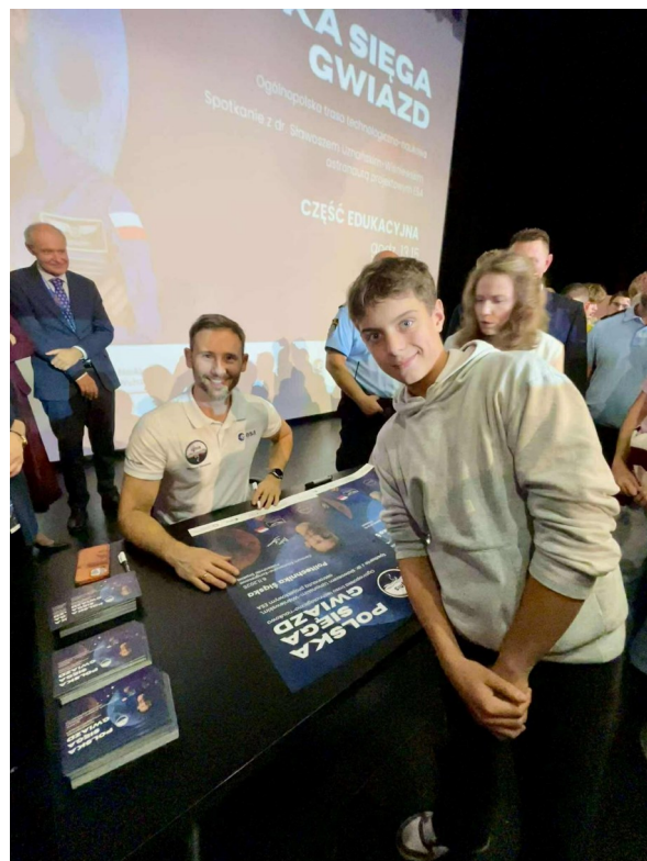
Spotkanie ze Sławoszem Uznańskim-Wiśniewskim

To właśnie z nim 6 listopada spotkali się uczniowie koła astronomicznego. Polski astronauta okazał się przesympatycznym, skromnym i niezwykle inspirującym człowiekiem. Opowiadał o swojej kosmicznej misji, szkoleniach i pracy w ESA, a uczniowie mieli niepowtarzalną okazję zadać mu pytania i zdobyć autograf prawdziwego astronauty!